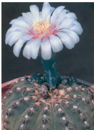
Figure 2 : Gymnocalycium altagraciense nom prov., toujours dans les limbes après 24 ans ...

Il m'a donc semblé utile, non seulement pour ceux qui gardent jalousement mon livre, mais aussi pour ceux nouvellement piqués par l'étrange attraction pour ce genre, de refaire un point sur ce qui a changé (pas tellement en fait) depuis 1995. Donc, vous trouverez ici la première partie.